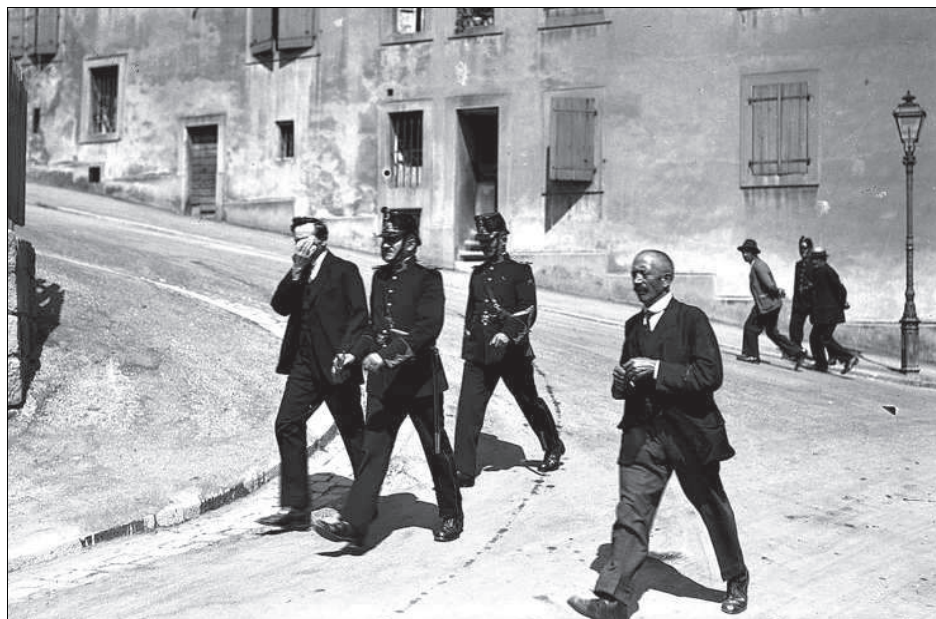
L'assassin d'un épicier emmené par la police, en 1924. A cette époque, le Rôtillon, la rue Centrale et ses abords constituaient les zones mal famées. Le Musée historique de Lausanne consacre une exposition à la criminalité dans la ville depuis le Moyen Age. ► Page 8